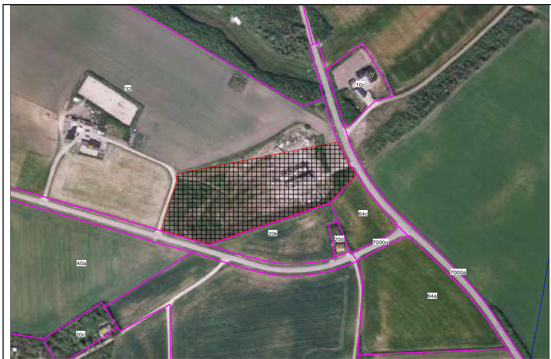
32, Lynghøj, Trans