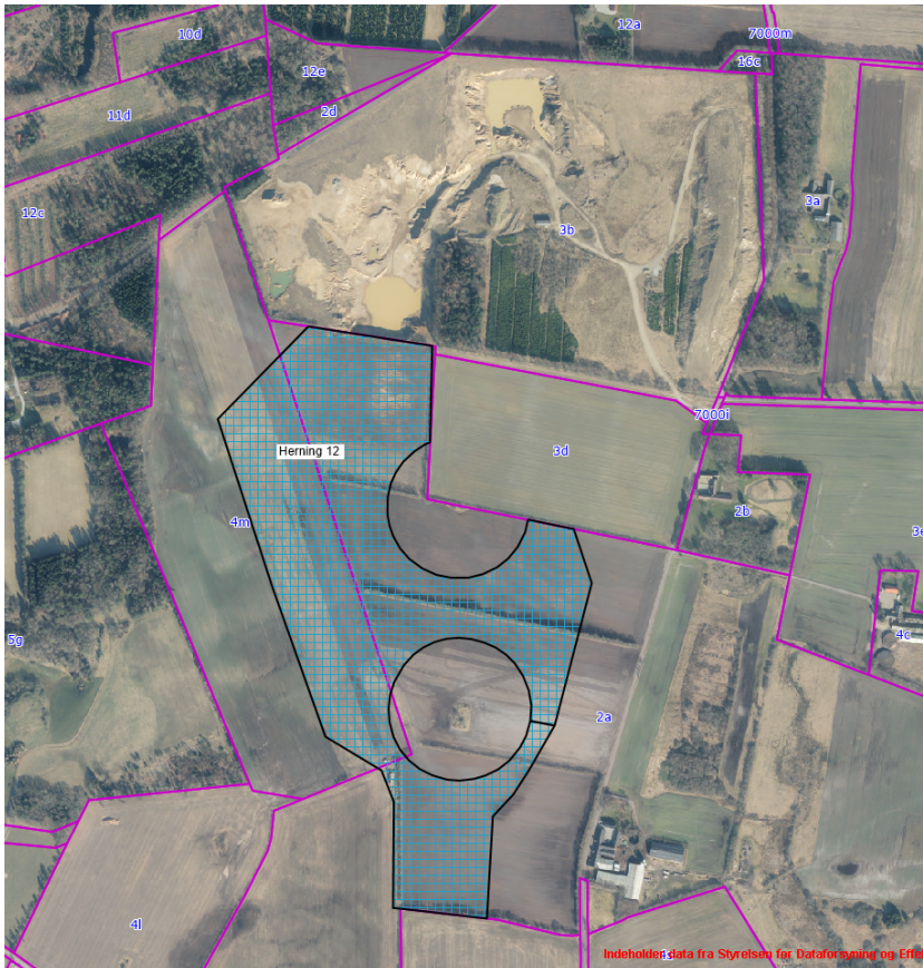
Figur 1. Kortudsnittet viser tilladelsens areal (blåternet flade) og matrikelskel (pink linjer) på luftfoto fra forår 2022.