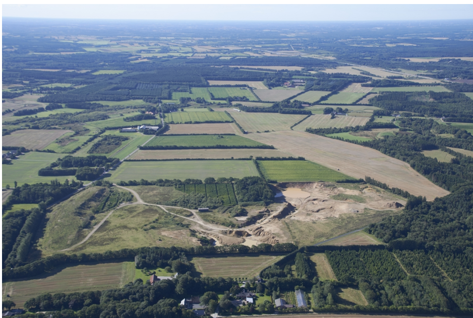
Figur 2. Skråfotoet viser tilladelsens areal (ikke aftegnet) set i sydlig retning, med Stokkildhovedvej i venstre side af fotoet og den tidligere råstofgrav (nord for tilladelsens areal) vist i forgrunden.