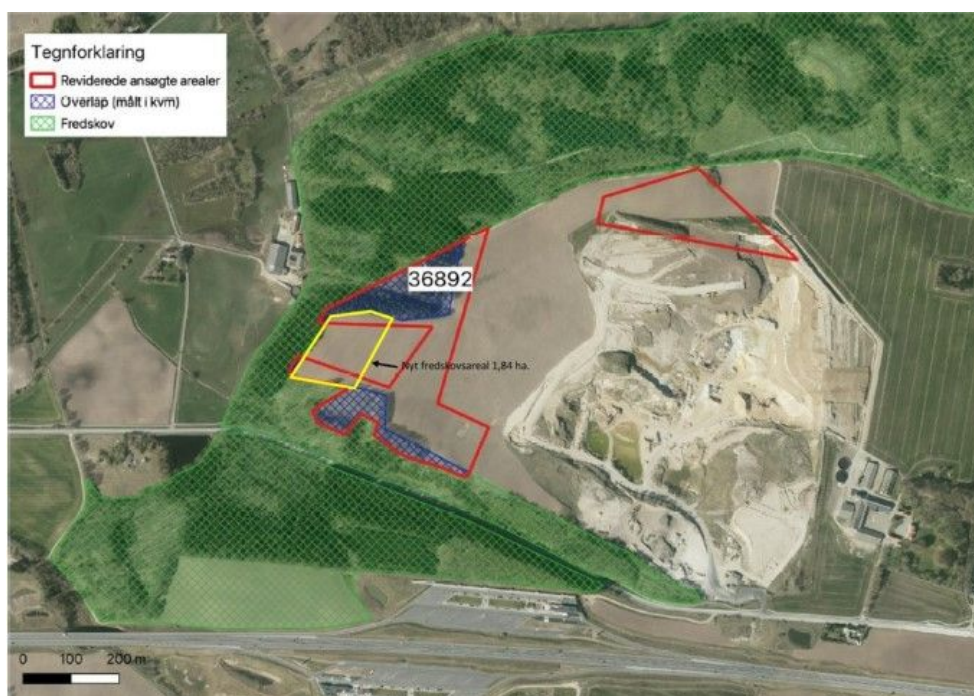
Fra ansøgning – berørt fredskovsareal vist med blå skravering.