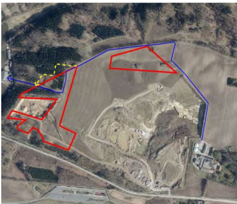
Fra miljøkonsekvensrapporten. Eksisterende grusvej/sti mellem Kalbygård og Bjarupvej (vist med blå streg). Forslag til ny sti (gul stiptet linje).

Skanderborg Kommune oplyser den 28. juni 2022, at der ikke er taget stilling til den præcise beliggenhed for stien der planlægges omlagt. Miljøstyrelsen kan oplyse, at en ny skovvej eller sti, der er nødvendig for skovdriften – herunder rekreative hensyn i skovdriften – kan anlægges uden dispensation fra skovloven. Etablering af en ny skovvej, der ikke sker af hensyn til skovdriften, kræver derimod en dispensation fra skovloven.