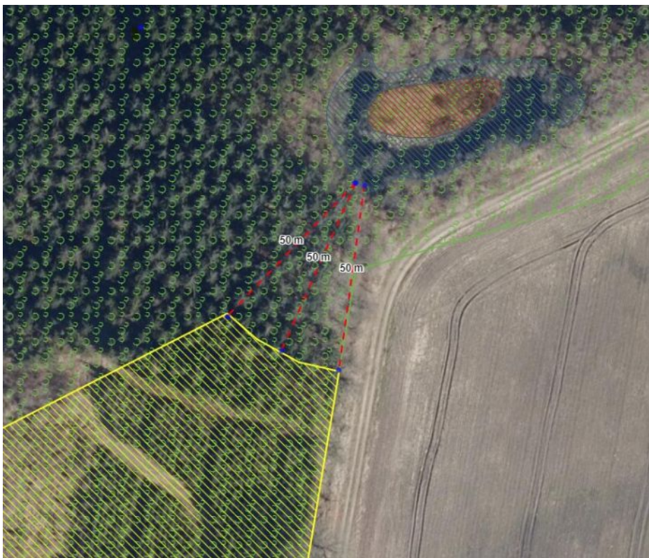
Dispensationsareal gul skravering, blå skravering er naturbeskyttet vandhul.

Fundet sydvest for det ansøgte areal ligger på den anden side af en hovedvej, og ligger op til et skovområde som også er syd for vejen.