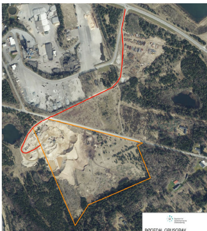
Figur 1. Uddrag fra ansøgningens angivelse af det ansøgte indvindingsareal med gul streg og transportvej med rød streg.

Der er søgt om tilladelse til fortsat erhvervsmæssig indvinding af råstoffer på matr.nr. 2l Brårup By, Grønbæk i Silkeborg Kommune