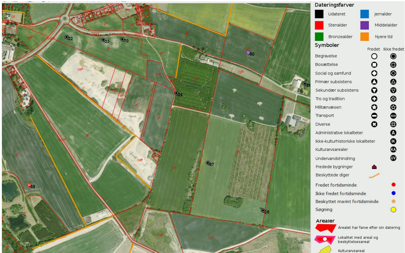
Figur 1 Det forespurgte areal midt for, med registreringer fra det nationale register fund og fortidsminder.

Museum Østjylland har foretaget en arkivalsk kontrol af det forespurgte areal, og kan konstatere at arealet ligger midt på en et forløb af overpløjede høje (-22, -23, -24, -25, -70 og -87), hvoraf de sidste to er opdaget i påfaldende sent ved tilfældigheder, henholdsvis i 1991 ved anlæggelse af en vej og for -87s vedkommende på ældre kortmateriale i forbindelse med nærværende arkivalske kontrol. Af denne grund kan det ikke udelukkes at arealet, der potentielt udlægges til råstof indeholder flere uregistrerede høje.