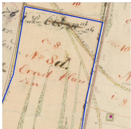
Figur 2 Den nyopdagede høj(-87) med lyserød markering, og råstofarealets omtrentlige udstrækning med blå streg.

Topografisk er der tale om letkuperet agerland på et større plateau, der mod syd er afgrænset af Hoed Å og mod nord af Spanggrøft.