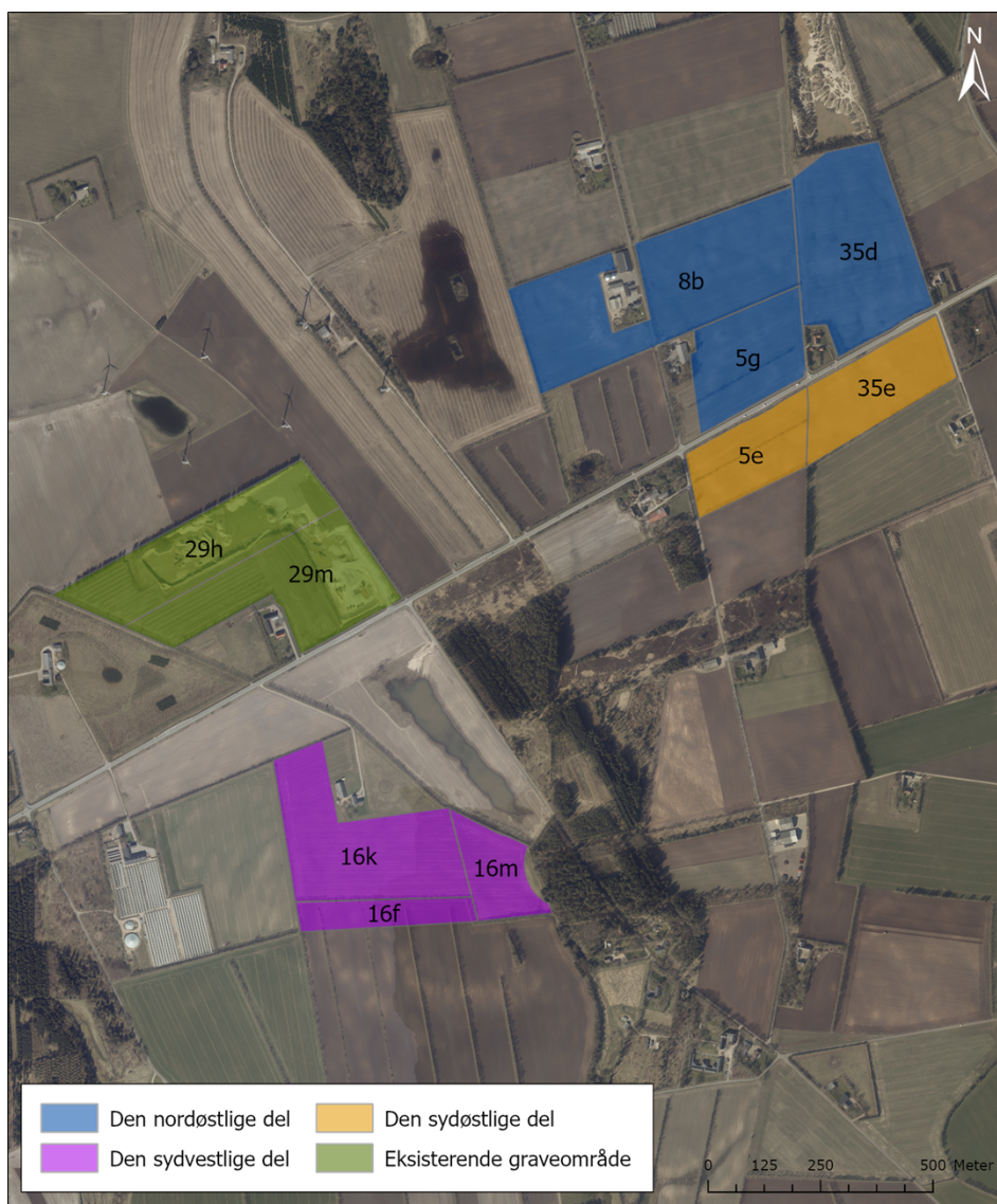
Figur 2. Oversigt over det ansøgte areal og den eksisterende råstofgrav.

Råstofindvindingen vil foregå med følgende materiel: