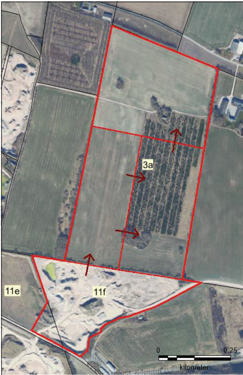
Kort 1: Graveplan

På matr. nr. 3a graves den vestlige etape før den østlige og nordlige etape. Den nordlige etape graves til sidst, mens den vestlige etape reetableres. Herefter reetableres den nordlige etape først, hvorefter Nymølle trækker sig ud af den østlige del. Med denne graveplan sikres, at det maksimale areal, der er åbent i løbet af graveperioden, er 32 hektar.