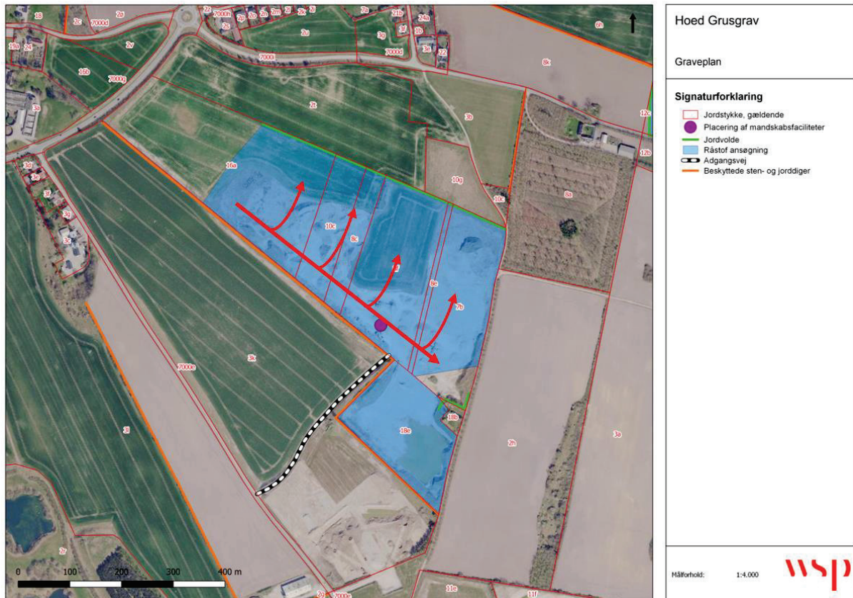
Figur 2.1. Graveplan for det ansøgte område. De røde pile angiver graveretningen hvor der ses, at der vil blive indvundet fra nordvest mod sydøst, hvorefter der for hver matrikel graves fra syd mod nord.

Råstofindvindingen i det ansøgte område er opdelt i en etape, som det fremgår af nedenstående figur 2.1.