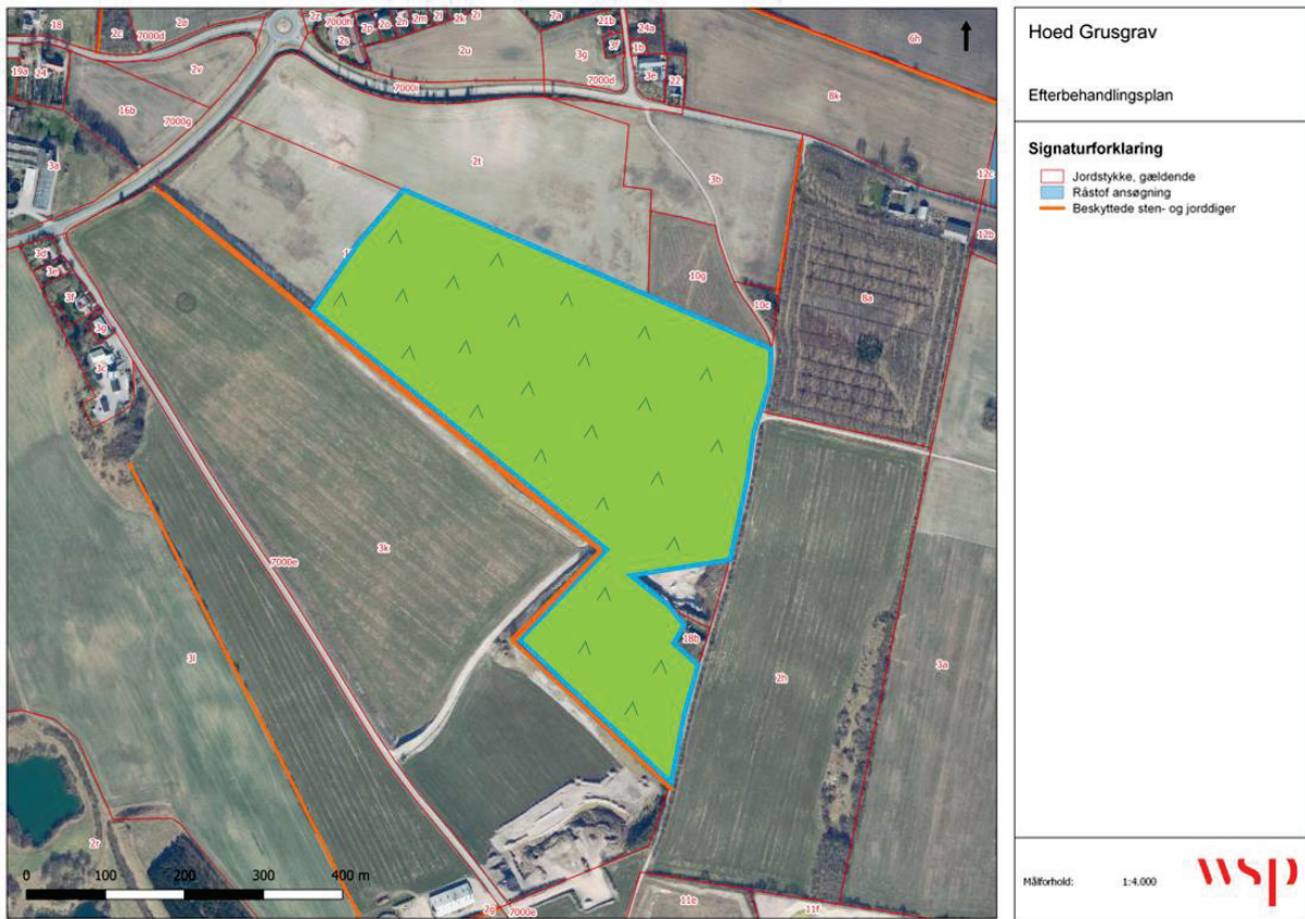
Figur 3.1. Efterbehandlingsplan for det ansøgte område, hvor der gives dispensation til modtagelse af ren jord efter jordforureningslovens § 52. Der vil blive efterbehandlet til jordbrugsmæssig drift, hvor jorden vil blive lagt ud så området kan blive efterbehandlet til det oprindelige terræn (kote 28-31 DVR90).