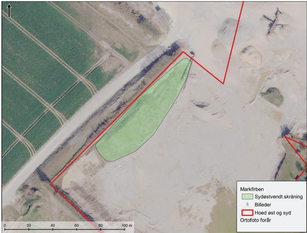
Figur 3.5. Sydøst-ventd skråning.

En stor del af denne skråning er stærkt tilgroet af ret høje græsser og urter. De få lysåbne områder på skråningen er som de andre i området dækket af en ret stor mængde løse sten i forskellige størrelser. Skråningen vurderes ikke at være et egnet yngle- eller rasteområde for markfirben, da tilgroningen er for massiv, og de lysåbne områder er for ustabile.