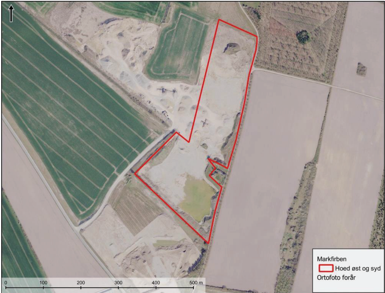
Figur 3.2. Den øst- og sydlige del af graveområdet, der blev grundigt besigtiget.