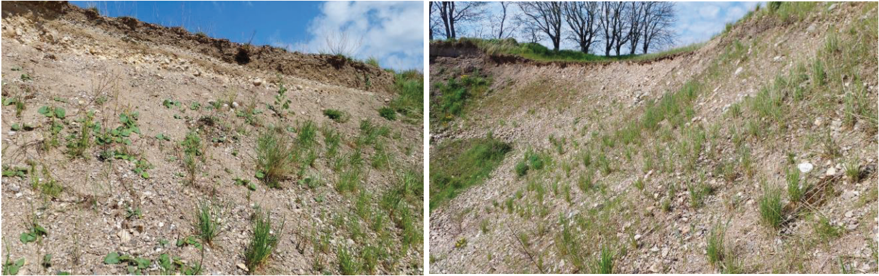
Billede 4. Billeder af de sydvendte skrån timer i det syd-vestligste hjørne af graveområdet.