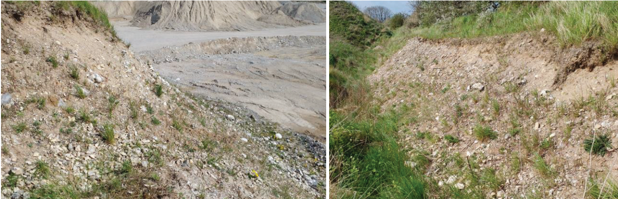
Billede 3. Billeder af den sydøst-vendte skråning med stor tilgroning og løse sten.