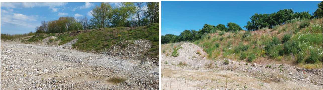
Billede 1. Vestvendt skråning med lav urtevegetation.