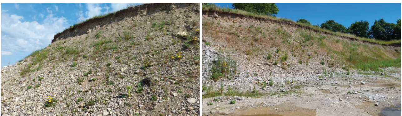
Billede 2. Billeder af den sydvendte skråning med mange rullesten.