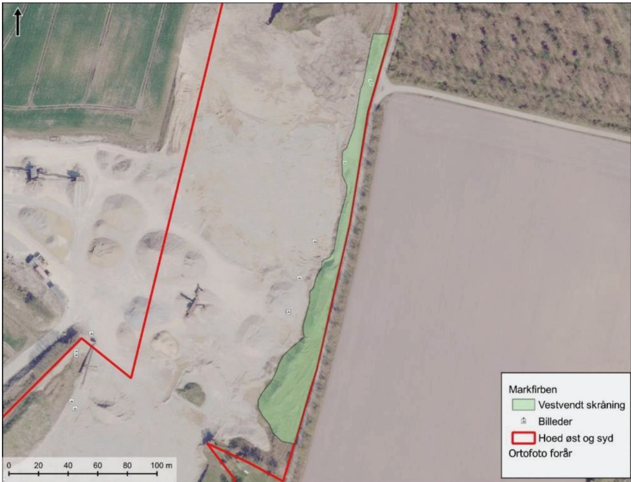
Figur 3.3. placering af den vestvendte skråning

Langs graveområdets nordøstlige grænse er der en skråning med lav urterig vegetation, hvor naturtilstanden vurderes som god. Denne kunne potentielt være et godt område for markfirben, hvis den havde været sydvendt. Da den er vestvendt, bliver den dog ikke varm nok og desuden er der mange knyttnævestore rullesten på de lysåbne overflade, hvilket er mindre optimalt biotop for markfirben.