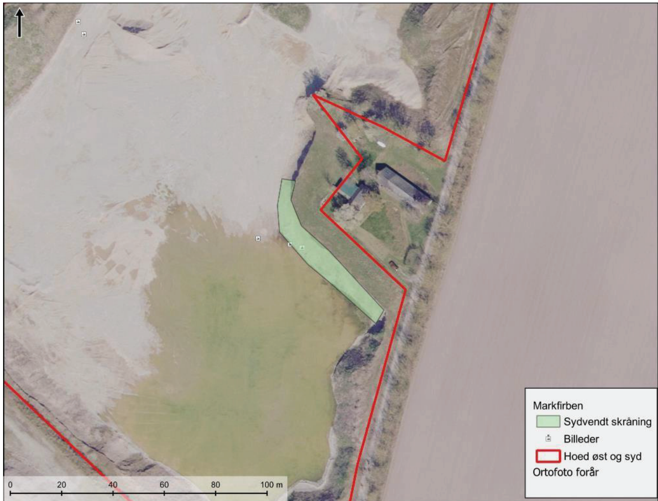
Figur 3.4. Sydvendt skråning

Syd for boligen på Glatved Strandvej 16, er der en sydvendt skråning med en smule urtebevoksning og ellers mange løse sten. Denne skråning er meget stejl, og der er mange løse sten på, hvilket betyder ustabil jordoverflade med mange forstyrrelser, hvilket generelt gør den uegnet som yngle- og rasteområde for markfirben.