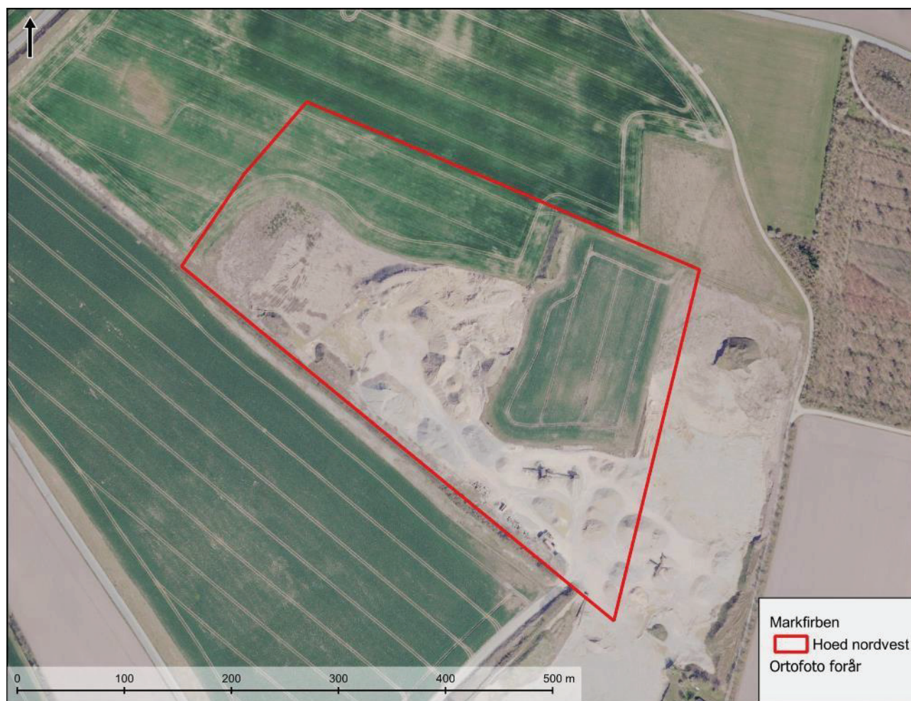
Figur 3.1. Nordvestlige del af graveområdet, hvor der er aktiv råstofgravning og flade marker.

Der blev ikke observeret markfirben ved nogle af besigtigelserne.