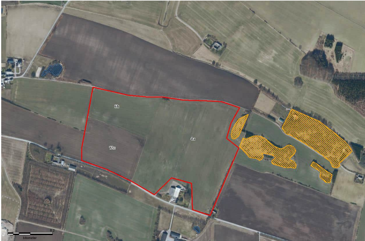
Figur 3. Området ved Glatved Strand med de omkringliggende § 3 beskyttede arealer.

De besigtigede markflader og markskel vurderes ikke at udgøre yngle- eller rasteområder for markfirben, da de ikke lever i velgødede omdriftsarealer, og der er tæt, skyggende vegetation på markskellene.