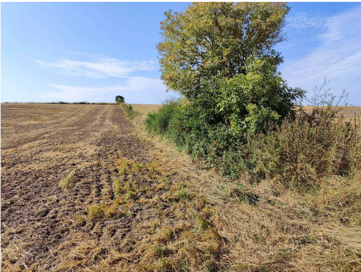
Agerjord med markskel/dige med høj græs- og urtevegetation og spredt krat. 29-05-2022 (øverst) og 14-08-2022 (nederst)