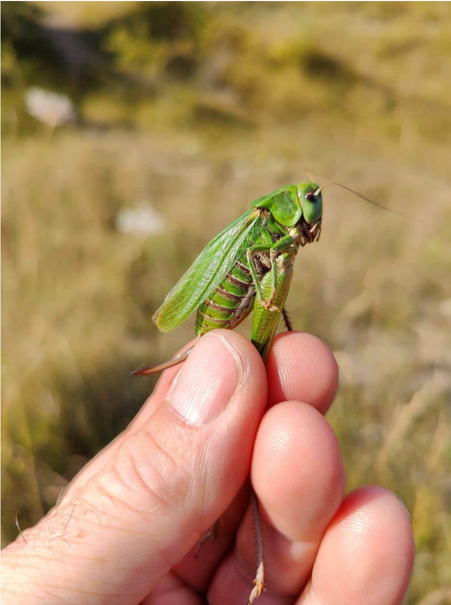
Græshoppen vortebidder fra grusgraven 14. august 2022.