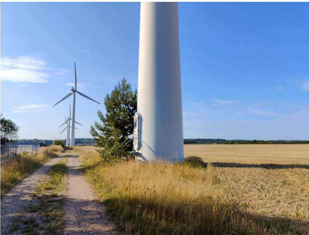
Adgangsvej til vindmøller med dige til venstre. 29-05-2022 (øverst) og 14-08-2022 (nederst)