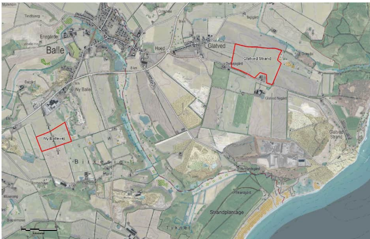
Figur 1. Oversigtskort med de 2 områder, vist med rød stregfarve.

I forbindelse med ansøgning om tilladelse til råstofvindning på to markarealer ved hhv. Ny Ballevej og Glatved Strandvej på Djursland for Gert Svith A/S, har WSP Danmark A/S screenet områderne og derpå foretaget feltbesigtigelse for forekomst af markfirben og for egnede levesteder for markfirben. Der henvises til oversigtskort, figur 1. Området sydvest for Balle benævnes Ny Ballevej, og området øst for Glatved benævnes Glatved Strand.