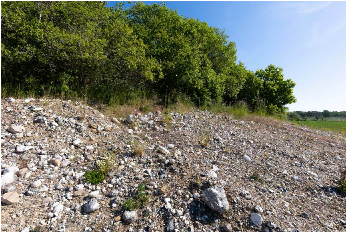
Lokalitet i grusgraven, hvor en tyk hun af markfirben blev observeret.

https://naturereport.miljoportal.dk/842639