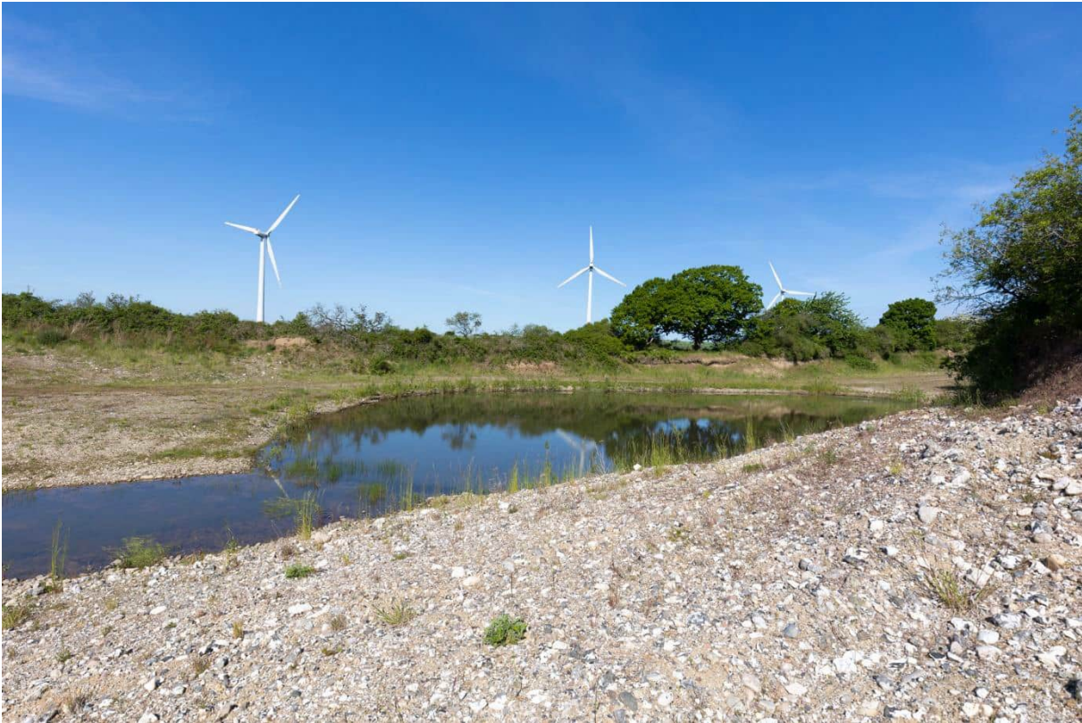
Grusgrav med masser af blottet mineraljord samt en sø. Vindmøllerne ses i baggrunden.