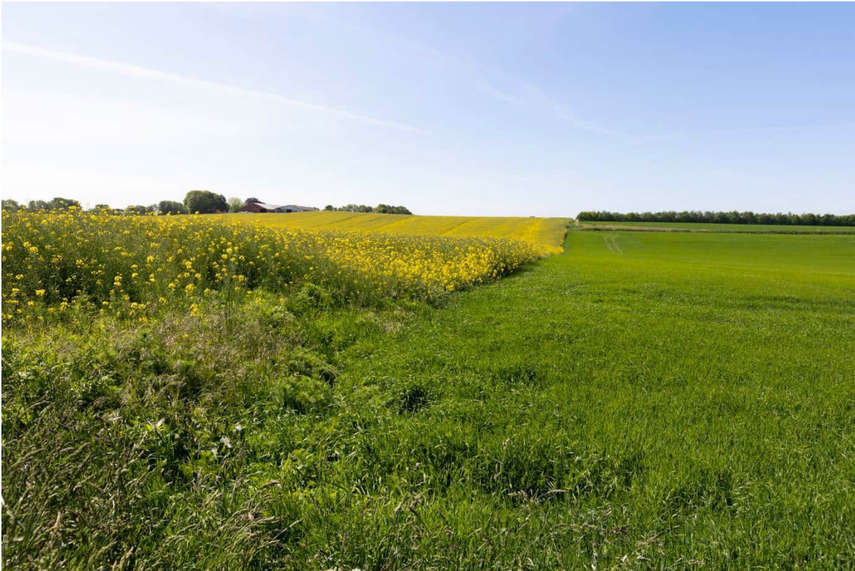
Grænse mellem græsmark og rapsmark

De besøgtede markflader er intensivt dyrket agerjord og vurderes på baggrund af besigtigelserne ikke at udgøre et egnet yngle- eller rasteområde for markfirben, da de høje afgrøder skygger jorden, og idet der ikke er soleksponerede skrænter, hvor arten kan solbade og lægge æg.