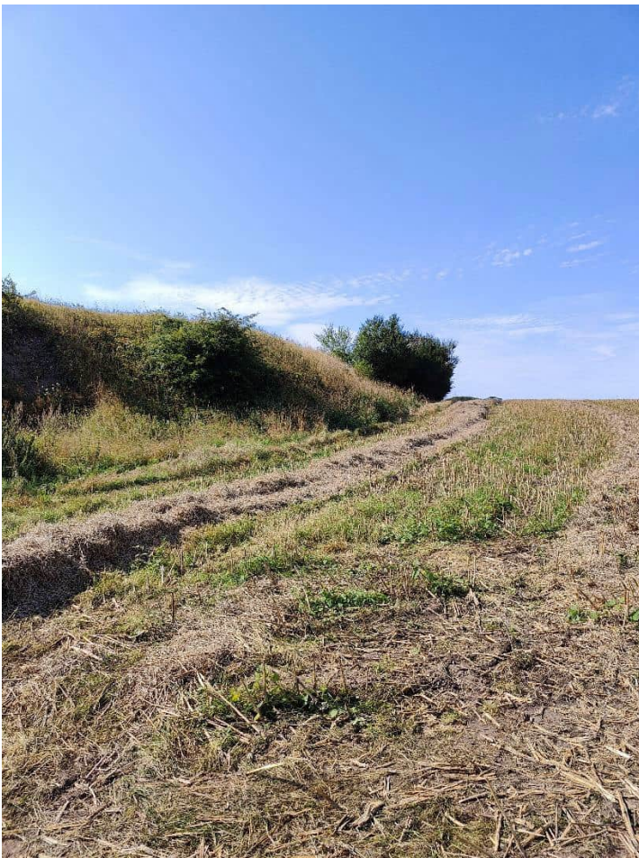
Overdrev på en skrænt ovenfor en rapsmark. Arealet lå uden græsning og der var en del ophobet græsførne. Øverste billede er fra 29-05-2022 og øverste er fra 14-08-2022.