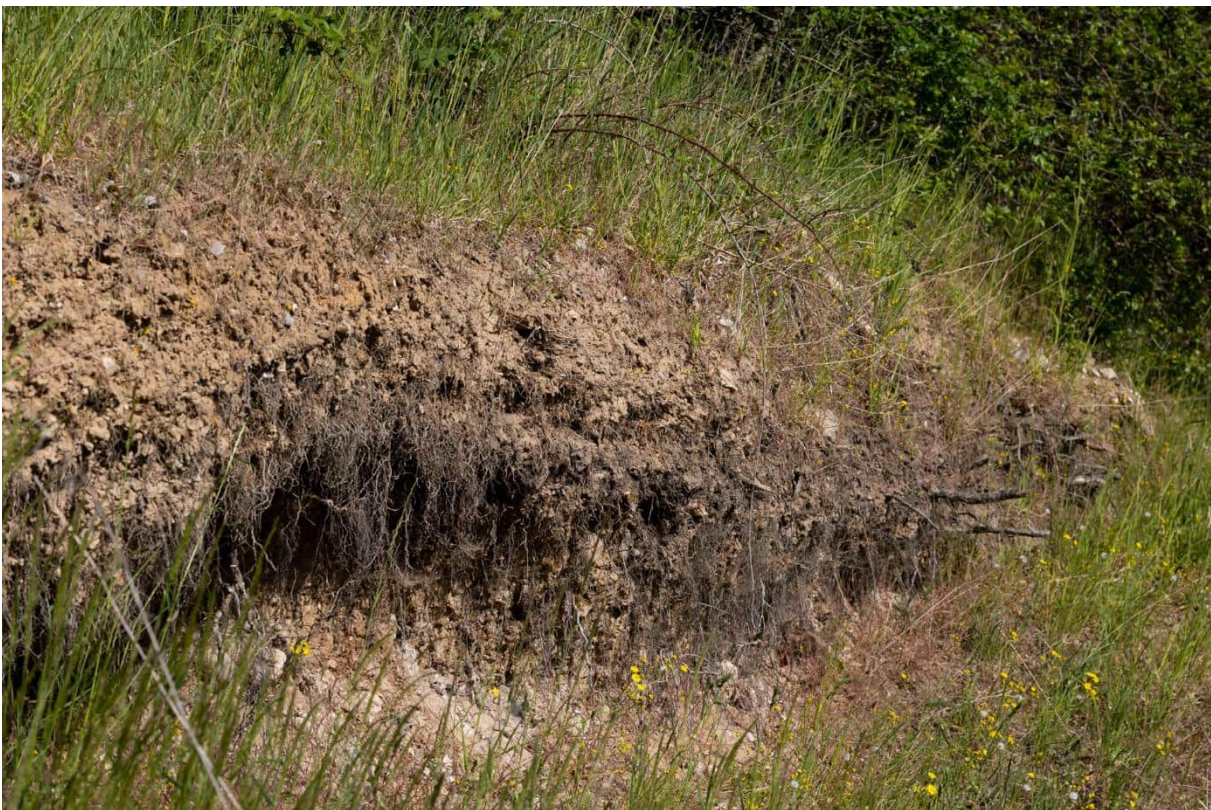
Blottet skrænt der vurderes at kunne være potentielt yngle- eller rasteområde for markfirben.