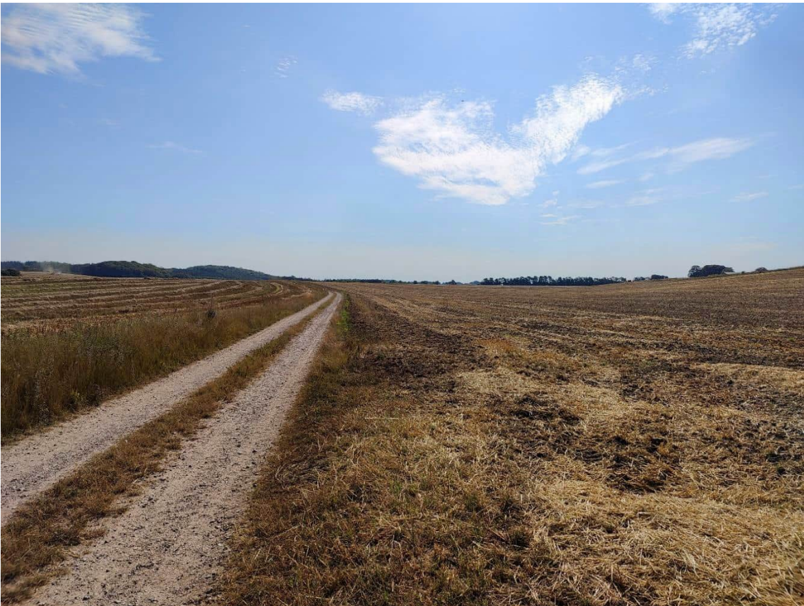
Agerjord hhv. 29-05-2022 og 14-08-2022.