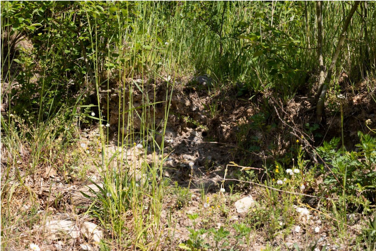
Blottet skrænt der vurderes at kunne være potentielt yngle- eller rasteområde for markfirben.