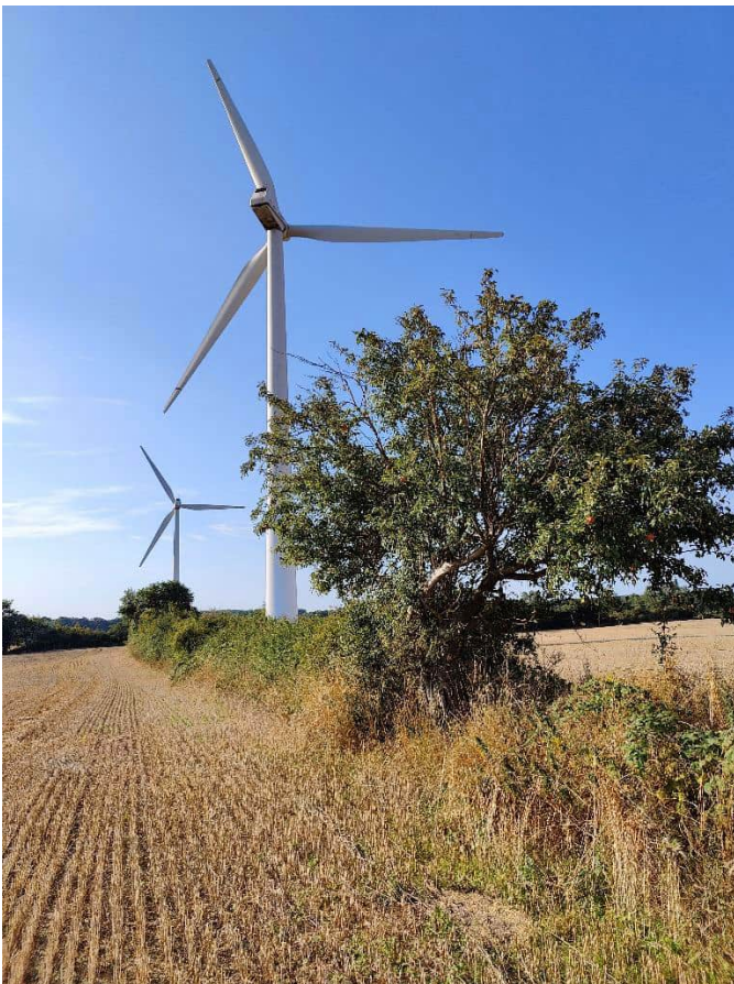
Kratvegetation på diger hhv. 29-05-2022 (øverst) og 14-08-2022 (nederst).