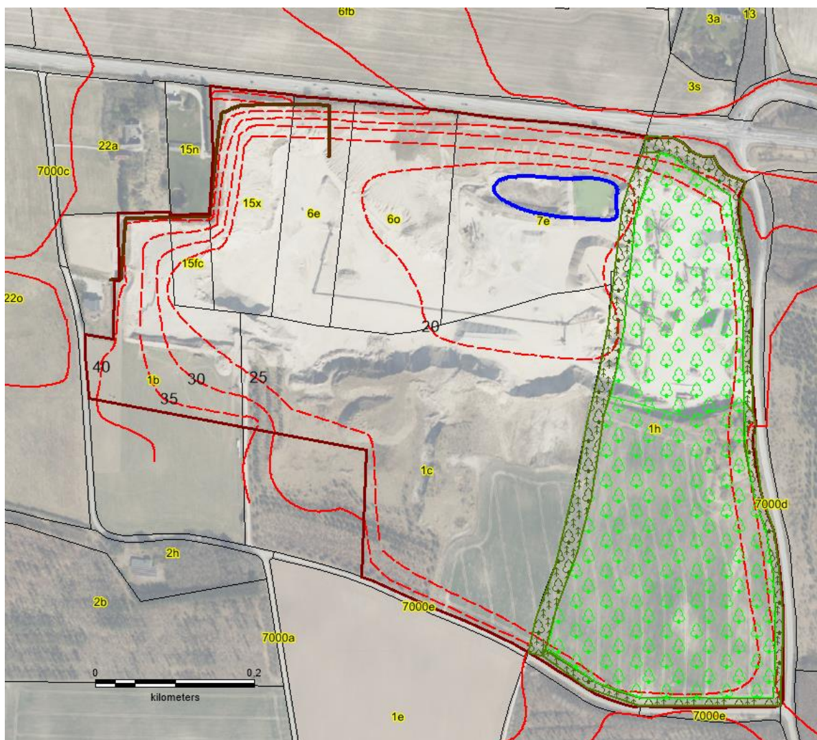
Kort 2: Vejledende koter for efterbehandling indenfor Romalt grusgrav. Søens placering og størrelse er ligeledes vejledende.

Matrikel 1h er omfattet af skovlovstilladelse og skal efterbehandles med skovtilplantning i overensstemmelse med Fussingø Statsskovdistrikts tilladelse af 21. januar 2004. Der tages udgangspunkt i beplantningsplan for matr. 1k efter aftale med Miljøstyrelsen. Planen omfatter løvtræsblanding med et skovbryn på 20 meter mod nord og vest og 10 meter mod syd og øst.